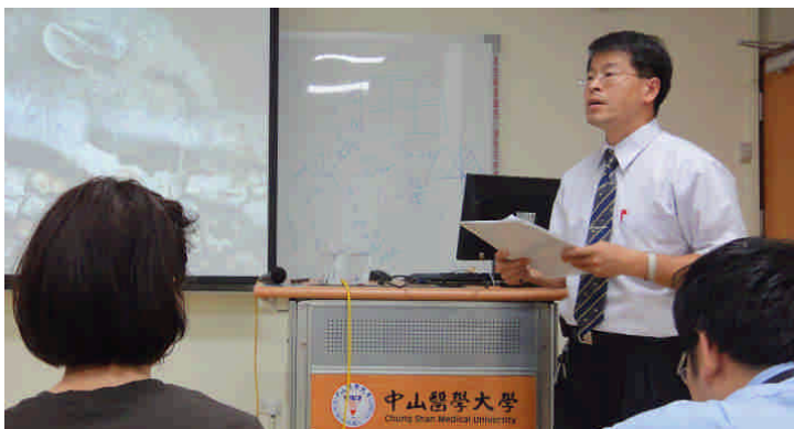
舉辦演講會進行學術交流